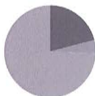
Nettoomsättningen fördelad på affärsområden 2018

■ Solenergi, produkter ■ VVS, tjänster och varor ■ Solenergi, elförsäljning