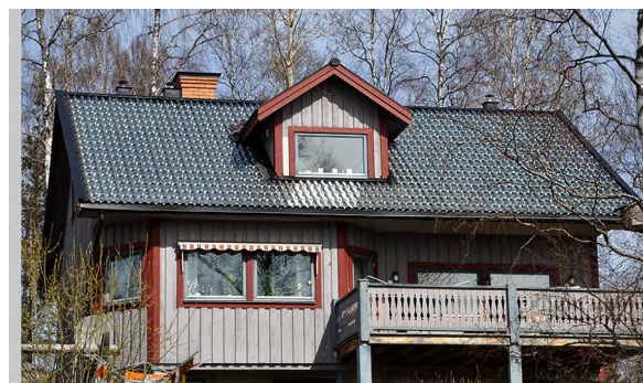
SolTech-installation i Svärdsjö, Dalarna