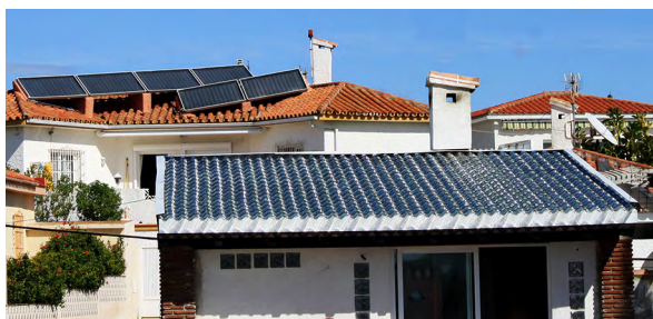
SolTech system i Urb. El Faro i Södra Spanien. I övre bildkant syns en traditionell anläggning

med el eller gasuppvärmning vanliga, även luft/vattenvärmepumpar förekommer. I de senare fallen kan Bolaget använda referenser från sina svenska system som principiellt har samma konfiguration. Som referensinstallation i Spanien har Bolaget valt att kombinera SolTech systemet med en vattenburen gasbrännarinstitution eftersom detta är mycket vanligt.