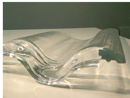
SolTechs specifika glastakpanna under tillverkning och i färdigt format.