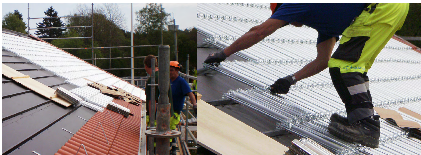
SolTech-installation på nära håll - Malmsjö skola i Grödinge, söder om Stockholm, i maj 2010.

Patent och övriga immaterialrättigheter syftar främst till att innehavaren av dessa, under skyddstiden, skall kunna sälja sin produkt i marknaden med