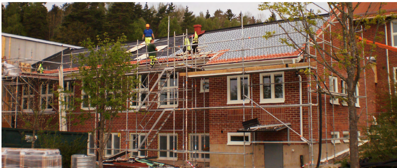
Pågående SolTech installation på Malmsjö skola i Grödinge söder om Stockholm, i maj 2010

I Spanien har Bolaget tillämpat en liknande strategi, dock förekommer inte där lika många olika typer av värmesystem som i Sverige. I princip värmer spanjorerna sina äldre hus med luftburna system (direktel) eller luft/luftvärmepumpar. I nyare hus och vid nyproduktion är vattenburna system