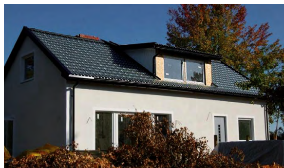
SolTech-installation i Tyresö, söder om Stockholm

Antalet anställda i moderbolaget uppgick vid årets slut till 8 personer (4). Antal anställda i koncernen uppgick till 9 (4). Ytterligare 3 personer var enga- gerade på konsultbasis.